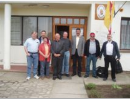
Sirnacher Gemeinderat vor dem Gemeindehaus in Helvécia (2007)