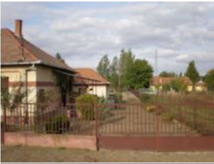
Das Dorf Helvécia