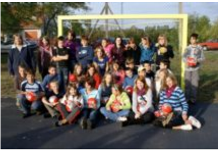
Schulklasse in Helvécia