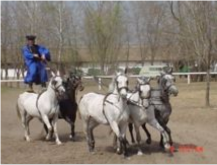
Reiterspiele in der Pusta