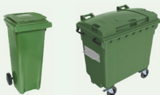
Rollcontainer mit Griff ab 120 Liter