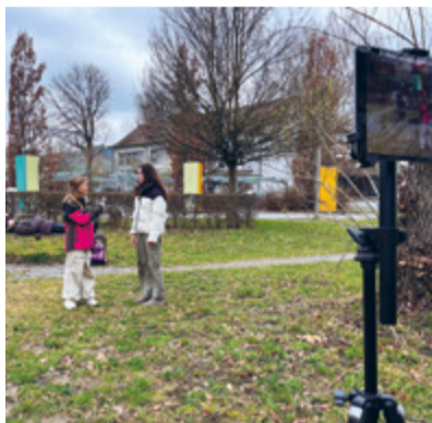
... auf dem Schulareal.