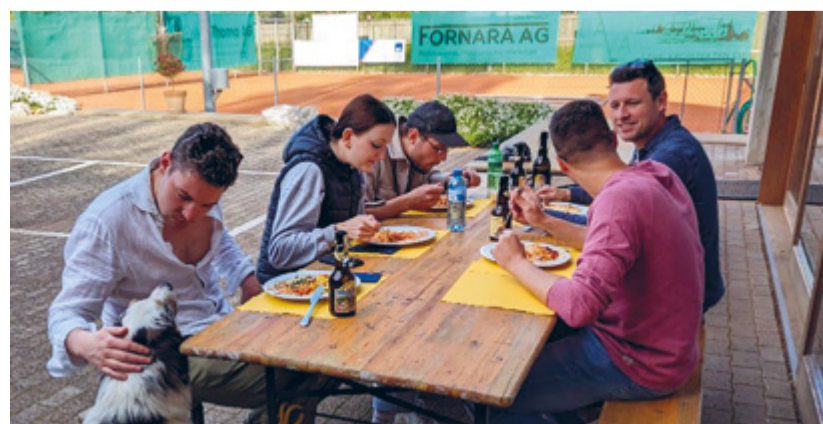
Die Spaghetti scheinen zu schmecken.