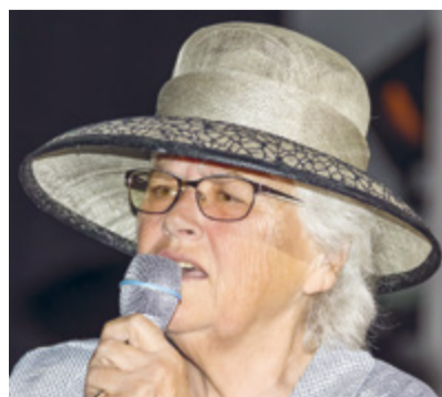
Bilder: Walter Kühne