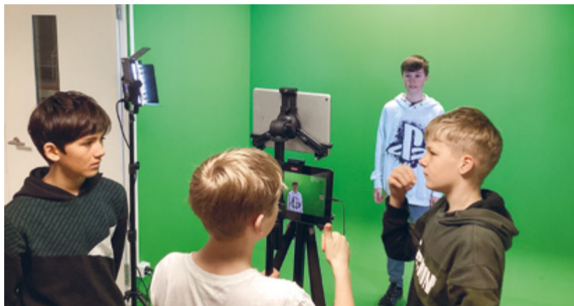
Aufnahmen in der Medienwerkstatt Sirnach und ...

Ziel dieser Zeit war es, dass die Schülerinnen und Schüler ihre eigene Egger Tagesschau produzieren. Um die Aufgabe gut zu meistern, wurde zuerst ein Blick hinter die Kamera geworfen. So verbrachten die Kinder im Januar einen Morgen im SRF-Studio. Die Kinder erhielten unter anderem in den verschiedenen Studios, in der Greenbox oder sogar in einer Liveradiosendung viele Einblicke. Auch in die Maske, in welcher schon Marco Odermatt oder Roger Federer sassen, durfte ein Blick geworfen werden.