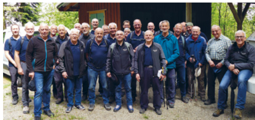
Erinnerungsbild vom Maibummel 2024.