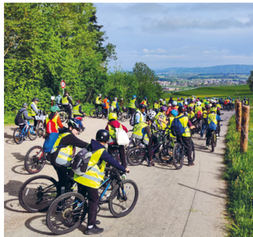
Mit dem Fahrrad unterwegs.