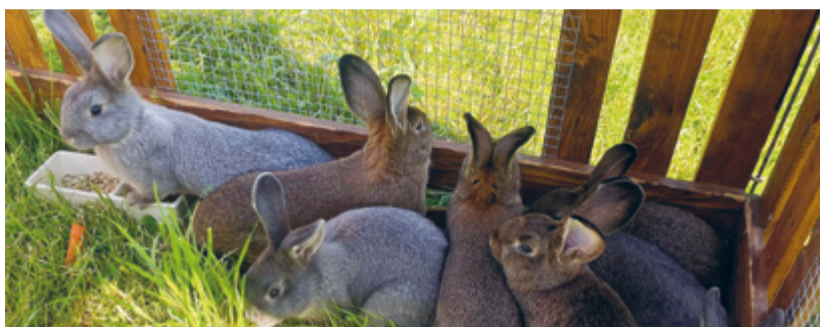
In der Schweiz 44 Kaninchenrassen, welche in über 100 Farbschlägen gezüchtet werden, anerkannt.