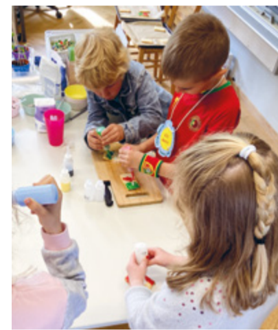
Europa-Guetzli verlieren ist gar nicht so einfach, macht aber Spass.