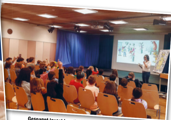
Gespannt lauschten die Schülerinnen und Schüler der unterhaltsamen Geschichte über die Monsterjäger.