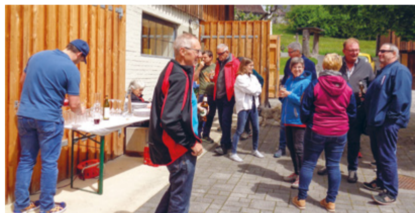
Gemütliche Stunden für die Sirnacher Musikantinnen und Musikanten.