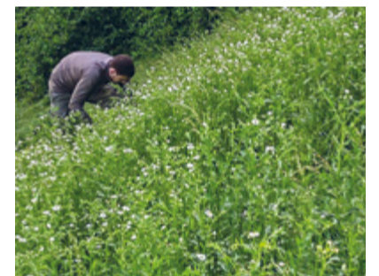
Ausreissen und richtig Entsorgen ist die effizienteste Methode, die unerwünschten Problempflanzen loszuwerden.

Eine Anmeldung der Freiwilligen ist erwünscht, damit genügend Gegrilltes und Getränke bereitstehen. Selbstverständlich können sich spontan Entschlossene auch direkt noch am Sammelplatz melden.