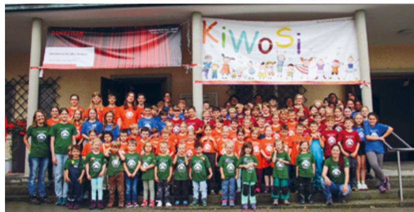
Lauter frohe Gesichter auf dem Erinnerungsbild der KiWoSi 2024.