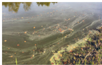
Schlieren im Wasser deuten auf eine erhöhte Blaualgenkonzentration hin.