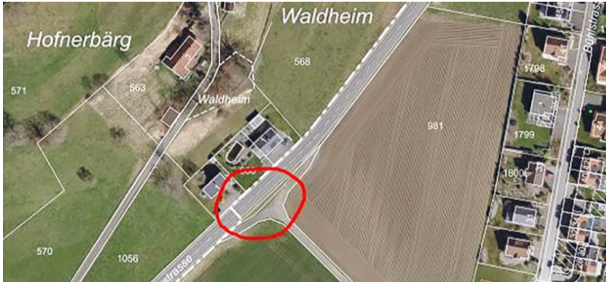
Die provisorische Haltestelle an der Münchwilerstrasse oberhalb vom Rosenberg.