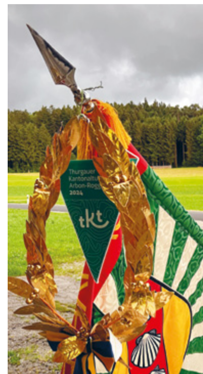
Ein goldener Lorbeerkrone an der Fahnnenspitze zeugt vom grossartigen Sieg.