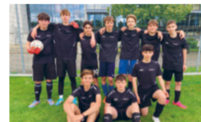
Team der 2. Sekundarklasse.

Besonders spannend verlief das Spiel gegen den späteren Sieger Wängi, welches durch einen schnell ausgeführten Freistoss entschieden wurde. Trotz dieser knappen Niederlage zeigte Sirnach weiter grossen Einsatz und kämpfte bis zum Schluss. Am Ende reichte es zum vierten Gruppenrang. Auch wenn es auf dem Platz nicht immer wie gewünscht lief, blieb die Stimmung neben dem Platz stets positiv. Die Schüler gaben ihr Bestes und unterstützten sich gegenseitig, was zu einer tollen Atmosphäre beitrug. Der Zusammenhalt und die Freude am Spiel standen an diesem Tag im Vordergrund.