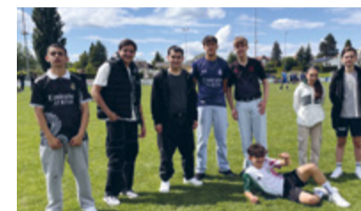
Team der 3. Sekundarklasse.