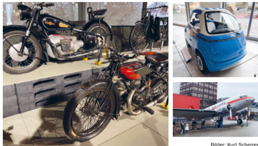
Bilder: Kurt Scherrer