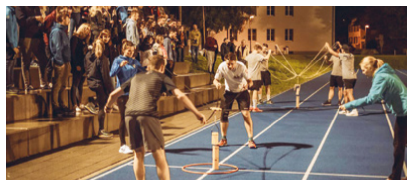
Finalspiel an der Murgtrophy 2021.