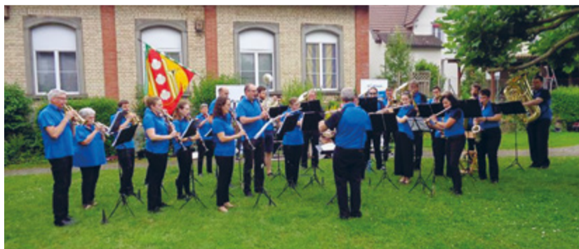
Die traditionellen Sommerkonzerte der MG Sirnach stiessen beim Publikum auch dieses Jahr auf Interesse und Begeisterung.