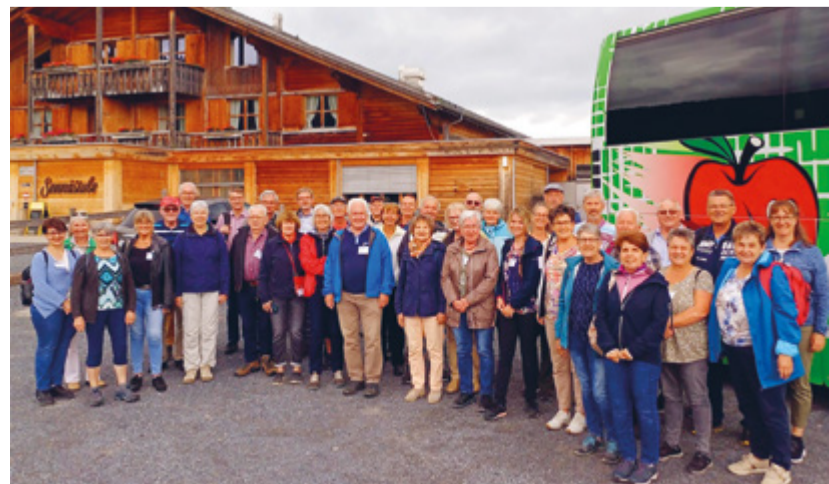
Erinnerungsbild an einen wunderschönen Tag voller toller Eindrücke.