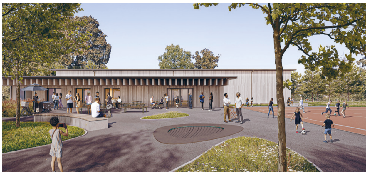
Visualisierung Aussenansicht der Dreifachsporthalle Birkenweg.

Gemeinderat und Baukommission Dreifachsporthalle