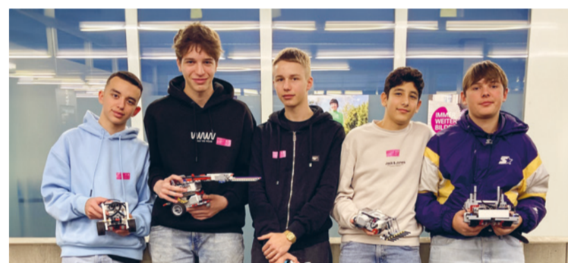
Die Schüler der Sek Sirnach belegten in der Gesamtwertung den elften Rang

In vier Disziplinen waren die Aufgaben bereits vor dem Wettbewerb bekannt, während die fünfte Disziplin, die sogenannte Überraschungsaufgabe, erst