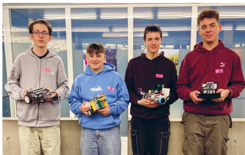
Die RebootBots landeten auf dem sechsten Gesamtrang – nur drei Punkte hinter dem Podest.