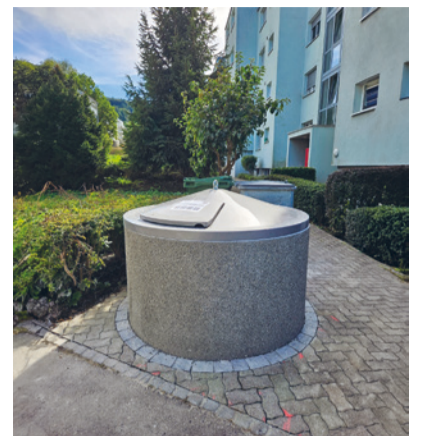
48 von 60 geplanten Unterflurbehältern sind in Sirnach bisher erstellt worden.