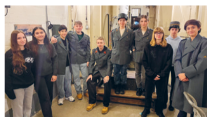
Schülerinnen und Schüler der Klasse 3Ec vor einer Bunkerkanone.