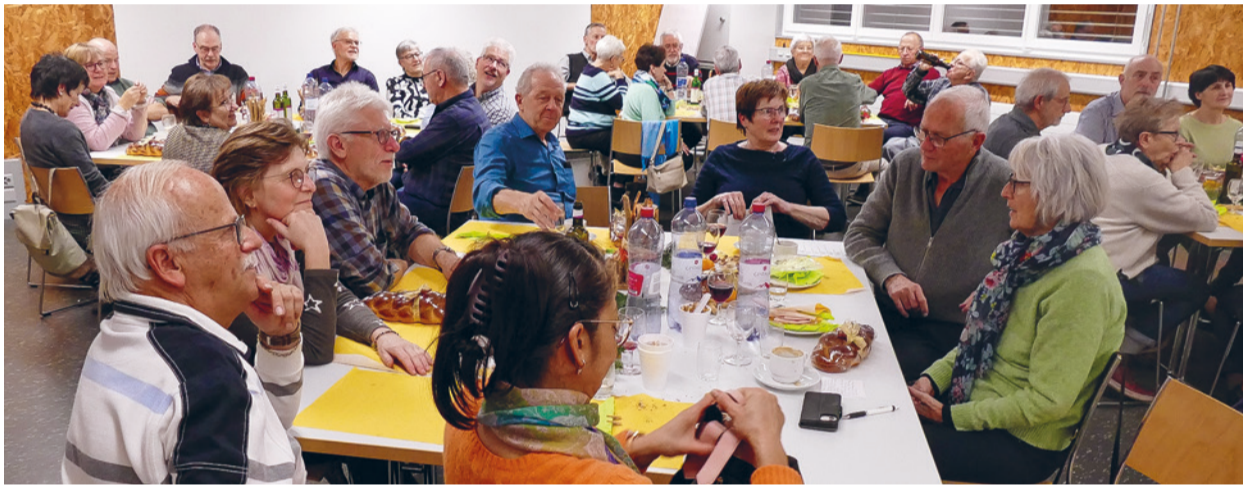
Der Chlausabend war einmal mehr der letzte Höhepunkt im Männerriegejahr.