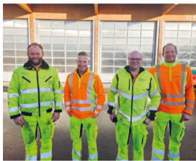
Unser Werkhof Weihnachtsbaum-Team.