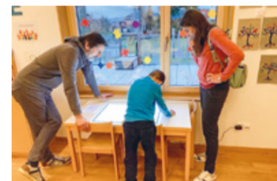
Ein Besuch im Kindergarten ermöglichte Einblicke in den Alltag der Kinder in einer unbeschwertten und einladenden Atmosphäre. Die Kindergartenkinder führten ihre Gäste stolz durch den Raum.