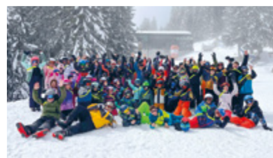
Ende Woche Winterwunderland für die 65 teilnehmenden Kinder.