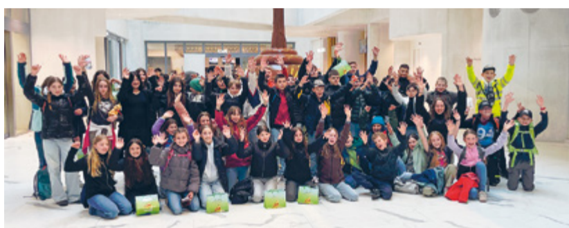
Begeistert erkundeten die Jungen Lindt-Fans das Schokoladenmuseum – ein süsses Highlight für alle.