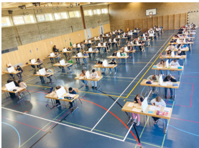
In der Turnhalle Grünau: Alle Kinder höchst konzentriert am Rechnen und Rätseln.