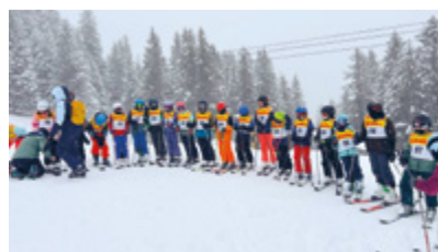
Mit Startnummer ausgerüstet für das Skirennen.

Klassenlehrpersonen, 5. Klassen Sirnach ■