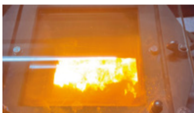
Kürzlich unternahm die 2. Einschulungsklasse (EK) des Oberen Schulhauses eine spannende Exkursion zur Abfallverwertungsanlage Bazenheid (ZAB) und erhielt dort interessante Einblicke in die Welt der Abfallverwertung.