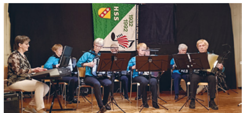
Die Abendunterhaltung im Restaurant Engel in Sirnach war ein voller Erfolg – ganz im Zeichen des diesjährigen Mottos «Genussvolle Augenblicke».