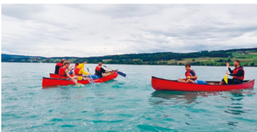
Spiel und Spass im Kennenlernlager in Beinwil am See.