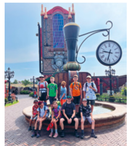
Die Jugendmusik Münchwilen-Sirnach beim Proben und unterwegs am Vereinsausflug nach Lipperswil ins Connyland – Musik, Gemeinschaft und Spass standen im Mittelpunkt.