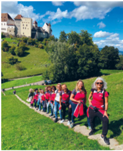
Der DTV Busswil erlebte eine spannende Reise nach Lenzburg.

Pünktlich um 7.35 Uhr (für einige fast zu früh) bestiegen zehn unternehmungslustige Damen des Turnvereins Busswil den Zug Richtung Lenzburg. Erste Station war das Stapferhaus mit der Ausstellung «Hauptsache gesund». Dort drehte sich alles rund um unsere Gesundheit – von A wie Arztbesuch bis Z wie Zuckerfalle. Interaktive Stationen luden zum Mitmachen und Nachdenken ein: Was brauche ich, um mich gesund zu fühlen? Und wie viel davon liegt überhaupt in unserer Hand? Die Antworten waren so vielfältig wie der Verein selbst. Frisch inspiriert zog es die Gruppe weiter zum Schloss Lenzburg, wo