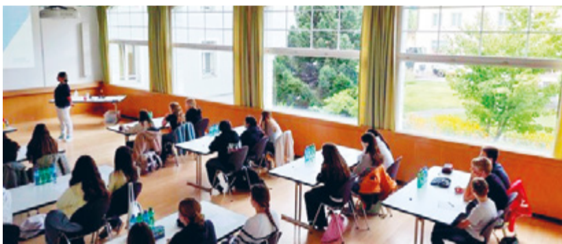
Vorstellung der Lehrberufe in der Rehaklinik Dussnang

Unterstützt wurden die Lehrpersonen in dieser Woche von zahlreichen Firmen, welche ihre Türen für eine Betriebsbesichtigung öffneten. Die Jugendlichen erfuhren viel über die Geschichte der einzelnen Firmen, durften den Berufsleuten bei ihrer Arbeit über die Schulter