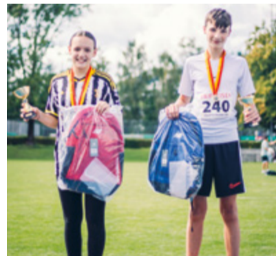
Die Sieger der Murg trophy (Bild links) und die schnellste Sirnacherin und der schnellste Sirnacher (Bild rechts).