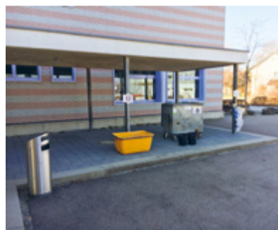
Die Sammelstelle vor dem Schulhaus.

Im Rahmen einer gross angelegten Dorfputzete leisteten die Jugendlichen einen wertvollen Beitrag für die lokale Umwelt und das Dorfbild. Über den Tag verteilt schwärmten die verschiedenen Klassen in ihre zugeteilten Rayons aus, um Sirnach von achtlos weggeworfenem Müll zu befreien. Während der jeweils rund eineinhalbstündigen Touren kam einiges zusammen: Der gesam-