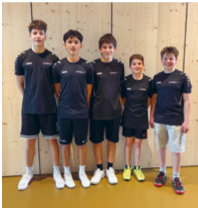
Ein motiviertes und einsatzfreudiges Team, das sich bereits jetzt auf das nächste Turnier freut.

In der KO-Phase wartete im Viertelfinale eine anspruchsvolle Aufgabe. Gegen die Mannschaft aus Bischofszell lieferten sich die Nachwuchsspieler zwei hart umkämpfte Sätze. Trotz grossem Einsatz mussten sie sich schliesslich geschlagen geben. Der Gegner brachte im