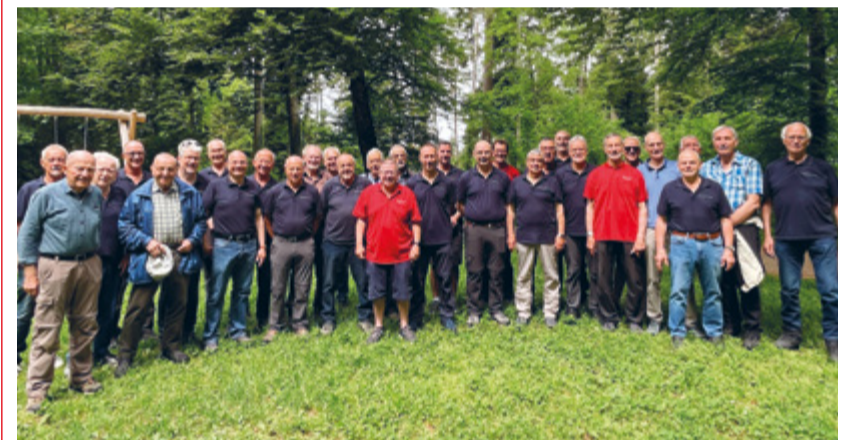
Die muntere Schar der Männerriege während dem Maibummel.