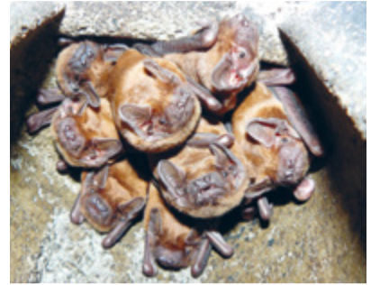
Eine Gruppe von Fledermäusen