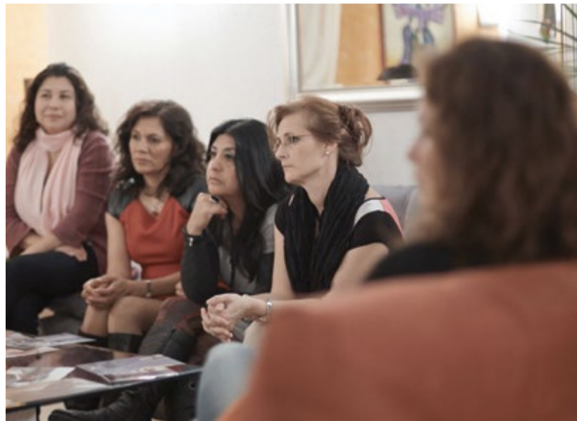
An den Femmes-Tische Runden diskutieren Frauen mit und ohne Migrationshintergrund, herzlich eingeladen sind auch Männer, unter Anleitung einer erfahrenen Moderatorin gemeinsam über verschiedenste lebensnahe Themen.

Stimmt die konservative Ansicht, dass früher die Männer arbeiten gegangen sind und die Frauen zu Hause für die Erziehung der Kinder zuständig waren? Nicht ganz. Es stimmt wohl eher, dass die Männer auswärts arbeiteten und die Frauen zu Hause den Garten versorgten,