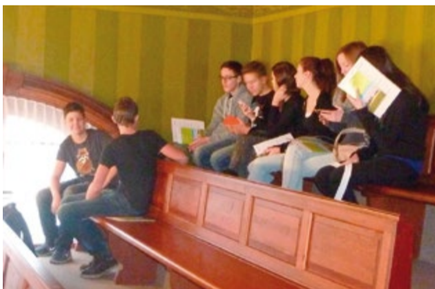
Von der Empore herab beobachteten die Sirnacher Sekundarschüler das Geschehen im Grossen Rat.