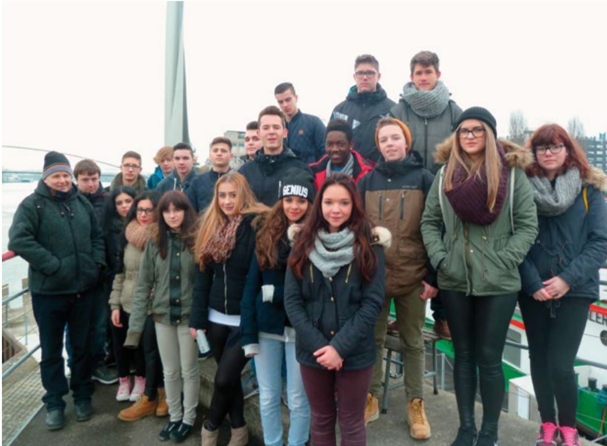
Klassenfoto der 3Ga am Dreiländereck.

Am Montag starteten wir die Woche mit der Fahrt nach Basel. Angekommen, bezogen wir die Zimmer im Backpack. Nach dem Lunch fuhren wir mit dem Tram nach Dornach. Da besuchten wir das Goetheanum, einen ganz speziellen Bau. Die anschließende Wanderung führte uns via Eremitage in Arlesheim nach Münchenstein. Am Dienstag lernten wir am Morgen die Altstadt von Basel kennen. Am Nachmittag besuchten wir das Fussballstadion St. Jakob-Park. Dank einer Führung konnten wir teilweise hinter die Kulissen schauen. Wir staunten über die riesige Logistik eines solchen Stadions und der dazugehörigen Organisation. Am Mittwoch besichtigten wir das Dreiländereck, einen Punkt, wo die Länder Deutschland, Frankreich und die Schweiz zusammen-