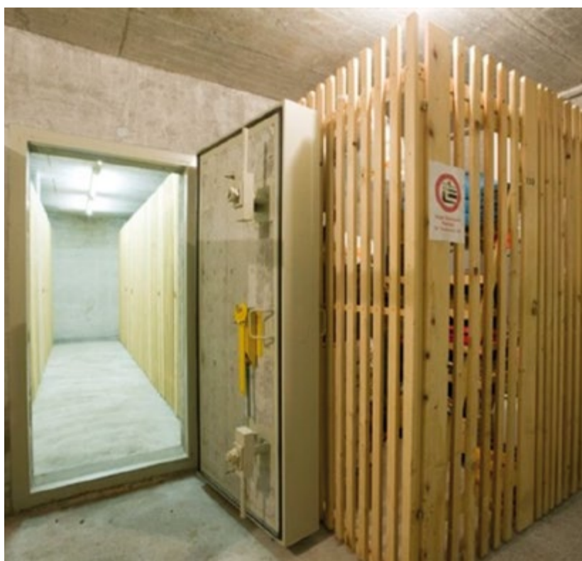
Alle zehn Jahre muss gemäss Gesetz eine Schutzraumkontrolle durchgeführt werden.

Vertreter) ist zwingend notwendig. Die Kontrolleure müssen sich auf Ihr Verlangen ausweisen können. Über das Resultat der Kontrolle wird ein Protokoll geführt, welches gegenseitig zu unterzeichnen ist. Sollte etwas mit dem Schutzraum nicht in Ordnung sein, wird darüber schriftlich informiert und es