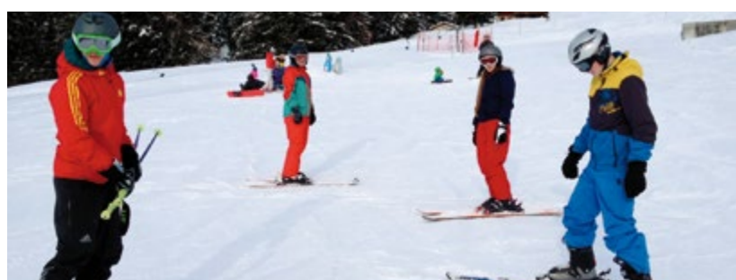
Die Sirnacher Sekundarschüler fanden im Skigebiet von Arosa-Lenzerheide optimale Bedingungen vor.

2865 Meter über Meer eignete sich sowohl für Anfänger als auch für Fortgeschrittene. Im Lagerhaus, in idyllischer Lage am Waldrand gelegen, herrschte eine gute Lagerstimmung. Das von den Schülerinnen und Schülern organisierte Abendprogramm sorgte drinnen wie draussen für Unterhaltung. Auch neben der Piste waren die Jugendlichen aktiv. Ob rasantes Schlitteln, wacklige Gehversuche auf Schlittschuhen be-