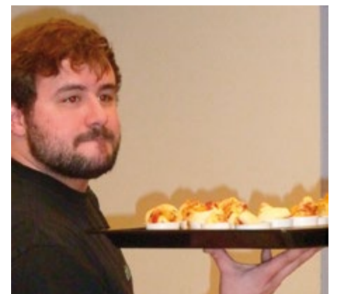
Die Sekundarschüler organisierten auch den Probe-Apéro.