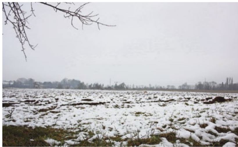
Die Bauherrschaft Rimaprojekt AG möchte mit den Bauarbeiten für den Fachmarkt «Ebnet» voraussichtlich Mitte 2016 starten.

Das Projekt Fachmarkt «Ebnet» hat die Bewilligungsbehörden insgesamt zwölf Jahre lang beschäftigt. In dieser Zeit sind nebst dem Bauprojekt ein Gestaltungsplan und ein Erschliessungsprojekt erstellt und in öffentlichen Ausschreibungsverfahren bewilligt worden. Damit hatten alle Interessierten und vom Projekt Betroffenen die Möglichkeit, Beschwerden und Einsprachen zu erheben. Die zahlreich eingegangenen Einsprachen sind in der Zwischenzeit erledigt worden und deren Entscheide in Rechts-