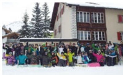
Gruppenfoto vor der Unterkunft.

Sirnach/Valbella – Am Montagmorgen starteten die Schüler in die Skilagerwoche. In Valbella angekommen, wurden zuerst die Zimmer bezogen, danach gab es eine heisse Suppe und schon ging es ab auf die Piste.