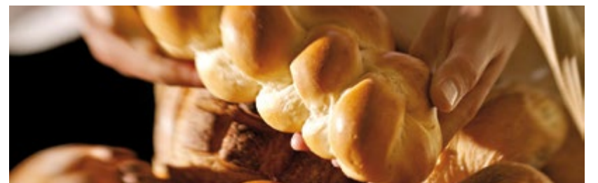
Das Panetarium, Egli & Sprenger, Café Botti und my language spendieren an den Zopf- und Kaffee-Samstagen abwechslungsweise einen grossen Zopf oder feine Cupcakes.

Finden Sie diese Zahlen nicht auch eindrücklich? Die Sirnacher Bibliothek weist eine durchschnittliche Besucherzahl von 2192 im Monat auf, was ebenfalls recht stattlich ist. Das Alter der Kundschaft verteilt sich vom Kleinkind bis zu den Senioren. Im Jahr 2014 sind 42418 Medien in der Bibliothek Sirnach ausgeliehen worden.