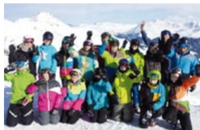
Grüsse von der Piste.

und trug zur guten Stimmung bei Schülern und Leitern bei. Am Montagabend fand eine Fackelwanderung mit Spielen, wie zum Beispiel Sackhüpfen im Schnee oder Modellieren von Tieren aus Schnee statt. Das war sehr amüsant. Am Dienstagabend fand ein super Spieleabend statt. Becherschiessen, Verkleiden oder andere zum Lachen bringen – wer lachte hatte verloren – standen auf dem