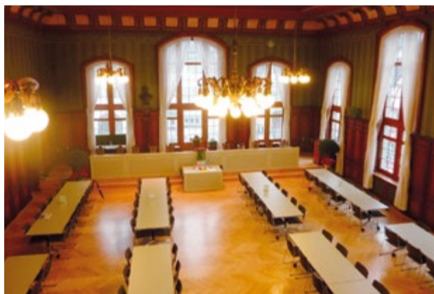
In diesem Saal im Rathaus in Weinfelden tagt der Thurgauer Kantonsrat.