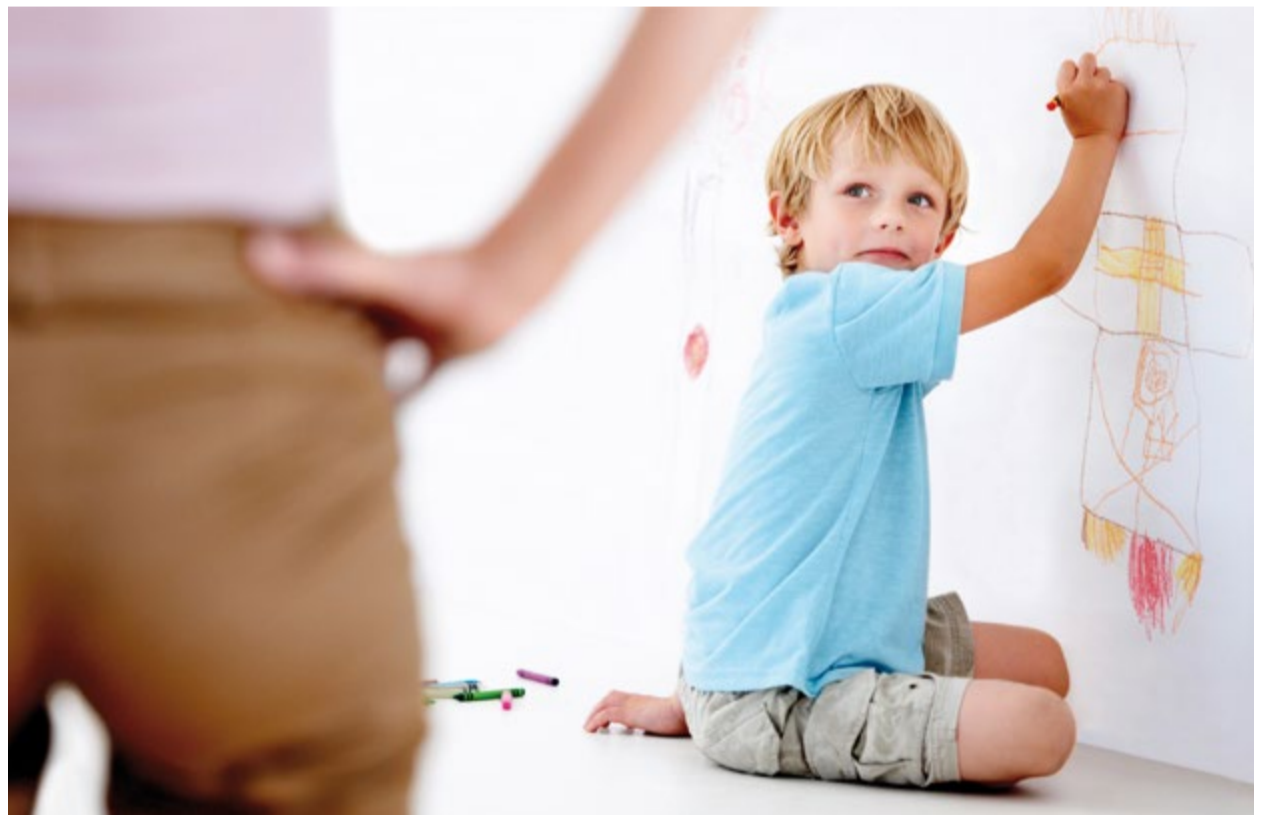
40000 Kinder und Jugendliche werden in der Schweiz jährlich zu Opfern sexueller Gewalt und sexuellem Missbrauch.

sich vielleicht fragen. Ja, es muss unbedingt – denn sexuelle Gewalt an Kindern, den schwächsten Gliedern unserer Gesellschaft, ist leider ein sehr verbreitetes Verbrechen. Schätzungen für die Schweiz gehen von jährlich 40000 Opfern unter Kindern und Jugendlichen im Alter von 1 bis 16 Jahren aus. Zahlen, die alarmieren und ein Engagement auf allen Ebenen erfordern – auch in der Schule.