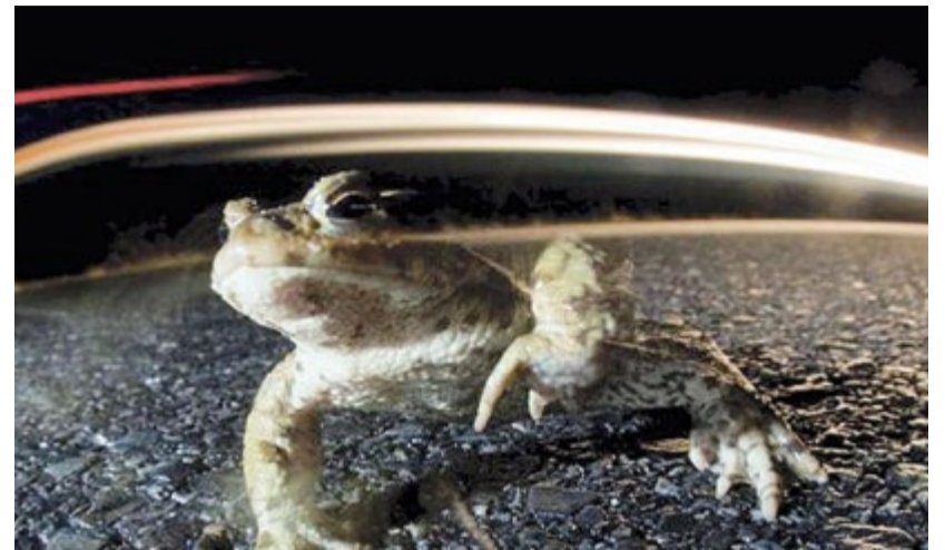
Um Kröten, Molche und Frösche bei ihrer Wanderung vor dem sicheren Verkehrstod zu bewahren, werden sich wiederum zahlreiche freiwillige Helfer dem Schutz der Amphibien annehmen.

Amphibien sind wechselwarm, sie passen ihre Körpertemperatur der Umgebung an. Für Erdkröten sollte es abends mindestens sechs Grad warm sein, Frösche mögen es wärmer. Wenn es dazu noch regnet, sind die Wanderbedingungen perfekt. Beim Einbruch der Dämmerung ziehen die Amphibien in Scharen los und wandern die ganze Nacht durch bis zum Morgengrauen. Tagsüber ruhen sie sich in einem Versteck aus, denn für Kröten und Elstern sind die Tierchen eine Delikatesse. Bereits ab Ende März wandern dann die ersten Lurchen wieder zurück, diesmal einzeln und viel