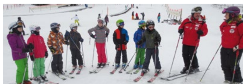
Zusammen mit erfahrenen Skilehrern verbrachten die Sirnacher Primarschüler einen tollen Skitag in den Flumserbergen.

In eindrücklicher Manier wurden viele der Kinder vom Sportgeschäft mit der notwendigen Ausrüstung ausgestattet, bevor dann der Unterricht mit den Skilehrern startete. Bei lachender Sonne und blauem Himmel