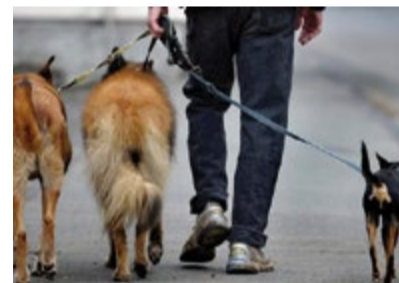
Die Hundehaltung ist an Regeln und Vorschriften gebunden.

Wer einen Hund erwirbt, muss innerhalb eines Jahres nach Anschaffung des Tieres einen Hundeeziehungskurs besuchen. Die anerkannte praktische Hundeeziehung umfasst einen Kurs mit Lerninhalten wie Lei-